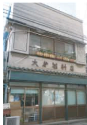
地域に多く見られる看板建築