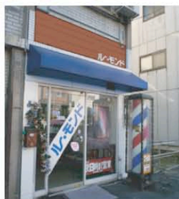
【実施後】木製の看板