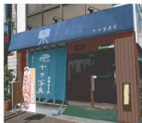
【実施後】布製の看板(庇)と間接照明