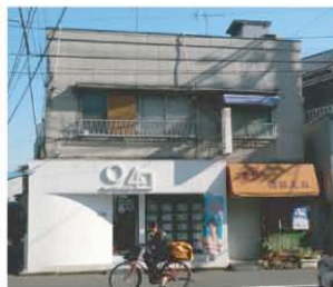
スケール感を保った リフォーム