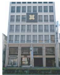
低層部のデザイン